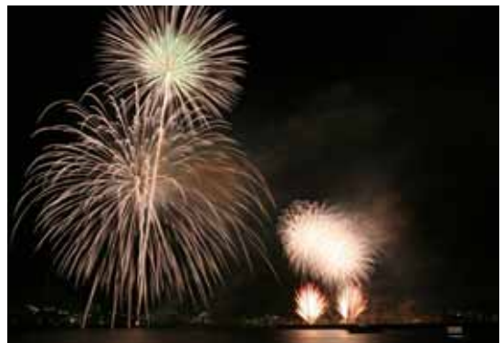
大勢の来場者を魅了した“音楽花火”

28日に宇部港にて開催。宇部の夏の風物詩である「音楽花火」を始めとする1万発の花火で12万1千人の来場者を魅了した。