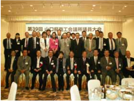
懇親会場のホテルかめ福にて記念撮影