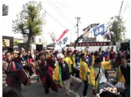
“情熱あふれる演舞”で来場者を魅了

青年部主催の同フェスタに36チーム500名が参加。メイン会場となった西日本シティ銀行周辺は“躍動感あふれる演舞”を目当てに多くの観客で賑わった。