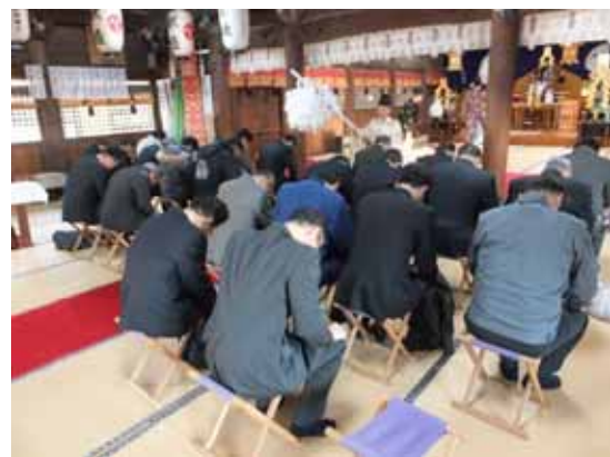
1年を通じての安全を祈願する参加者

11日に琴崎八幡宮で開催。幹事22名が参加し、建設工事の無事故と安全を祈願した。