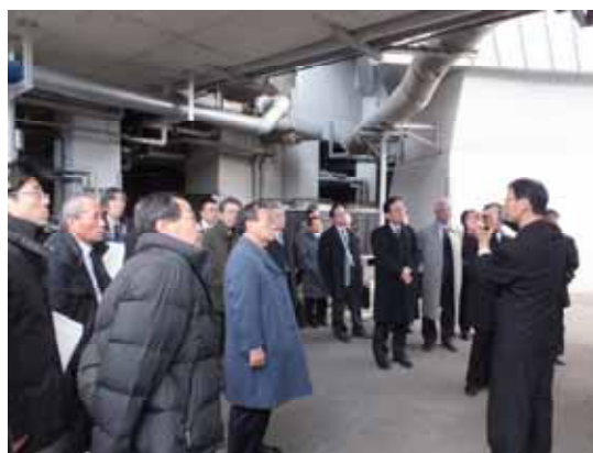
“各世代が交流する拠点作り”を目指す海響館

13日に下関引受にて開催。下関17名・宇部15名の計32名が参加し下関市立しものせき水族館「海響館」、JRC S(株)豊浦製作所を視察し、普段は立ち入ることのできない水族館のバックヤード等を見学した。見学終了後の懇親会では両商工会議所の部会員同士が交流を深めた。