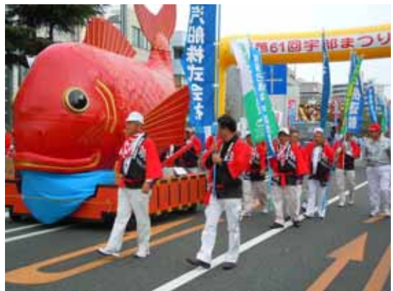
沿道の観衆を魅了した運輸港湾部会作成の「鯛の曳山」