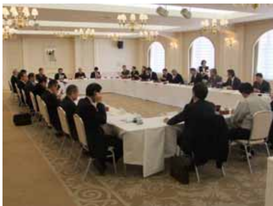
協議事項について審議を行う出席者

併せて卓話を開催し、山口県立美術館館長の西村亘氏を迎え「生誕100年松田正平展」について説明を受けた。