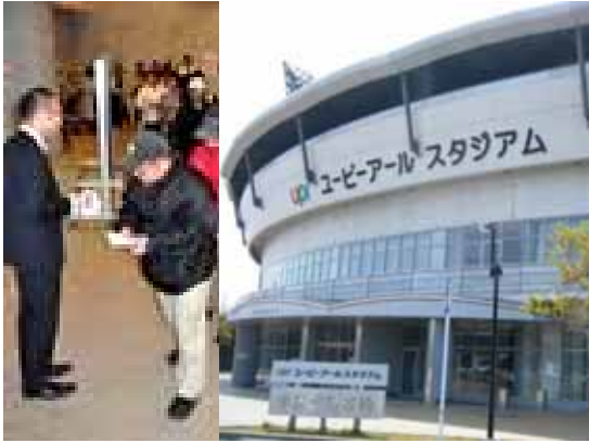
整理券を受け取りチケット購入に向かう来場者