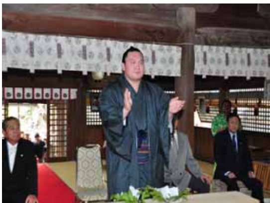
琴崎八幡宮に参拝する白鵬関