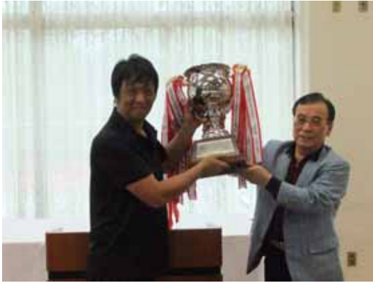
千葉会頭より「団体の部優勝」の萩商工会議所ヘトロフィー授与