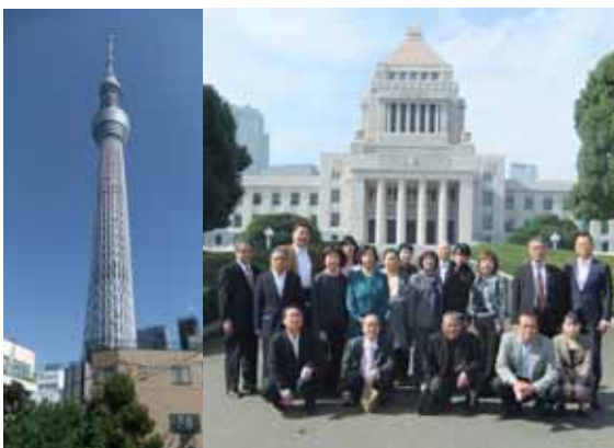
5月にオープンした東京の新名所「スカイツリー」

16日・17日に視察研修会を開催し、19名参加で今年5月にオープンした「東京スカイツリー」や国会議事堂を視察した。