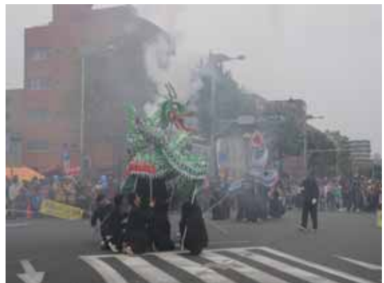
ゴール地点にて迫真の“竜踊り”を披露する宇部マテリアルズの皆さん