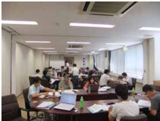
「起業」に向けての課題に取り組む受講者

7日に当所にて開講。起業を目指す28名が参加、全10回の講座を通じて起業に向けて基礎知識を学びビジネスプラン作成に取り組んだ。