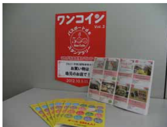
「お得情報」満載のワンコイン・パスポート

参加店は会員企業が対象で、昨年を上回る62店の参加があった。消費者からの応募通数についても昨年を上回り、参加店の周知・売上増に成果をあげた。