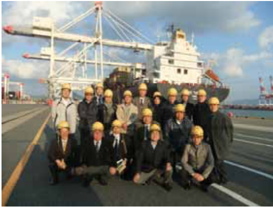
アイランドシティ福岡国際コンテナターミナルにて記念撮影