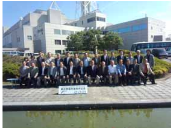
中国電力(株)柳井発電所前にて記念撮影

24日に視察研修会を開催。30名が参加し、柳井市の中国電力(株)柳井発電所、旭酒造(株)等を視察した。