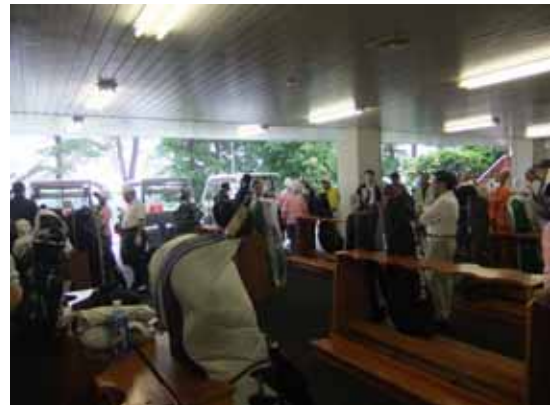
“熱戦前”のミーティング風景

16日に山口県西部地域6商工会議所(宇部・下関・小野田・萩・長門・山陽)の役員・議員等によるゴルフ大会が当所引き受けにて開催。当日は雨天となったが、雨にも負けない熱戦が繰り広げられ、参加した37名が懇親を深めながらプレーを楽しんだ。当所は団体の部3位。