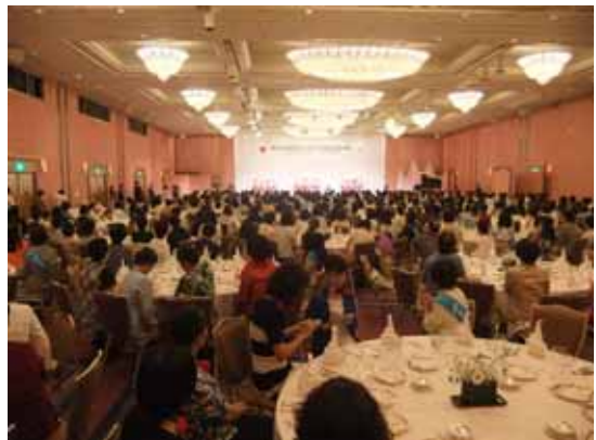
中国5県から619名が参加し、大会は大いに盛り上がった

23日・24日に開催。岡山県にて開催された同大会に20名が参加し、コシノヒロコ氏のトークショーや他女性会との交流を図った。翌24日には親睦旅行を実施した。