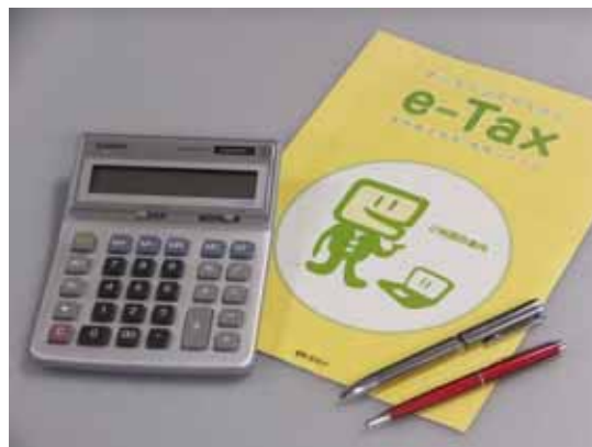
確定申告の相談には専門家等が対応

個人事業主を対象として、2月4日から3月15日まで当所にて「所得税・消費税確定申告有料相談コーナー」を開設し、会員・非会員を問わず多くの納税者が来所し確定申告手続きを行った。