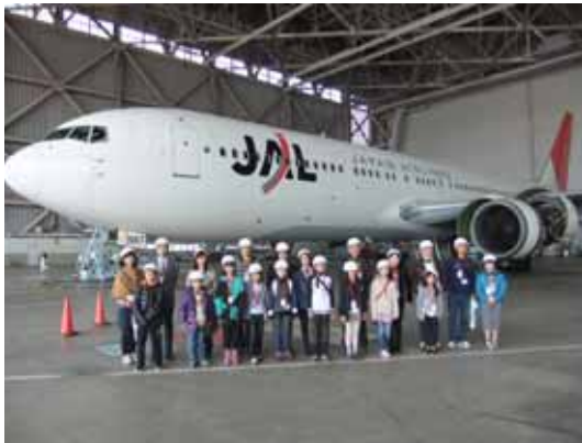
飛行機の整備工場にて記念撮影

4日に日本航空山口宇部営業所協賛にて「JALで行く学校では受けられない授業」を東京羽田空港にて開催。156組の応募の中から抽選で選ばれた親子10組20名が、JALの整備、乗務員、貨物の各部門を見学し航空業界の仕事について学んだ。