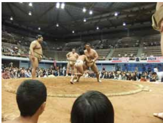
人気力士に胸を借りるちびっこ達

3日(前夜祭)、4日宇部まつり(本祭)に中心市街地で盛大に行われ、延べ25万人の人出で賑わった。今年は前夜祭に漫才師の「博多華丸・大吉」が登場し、大勢の観客が集まった。