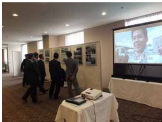
遊休機械無償マッチング支援プロジェクトのパネル展示

全国商工会議所のネットワークを活用し、各地の事業者から遊休機械等を無償で提供いただき、被災事業者の要望とのマッチングを諮り復興を支援するプロジェクトを当所においても推進。