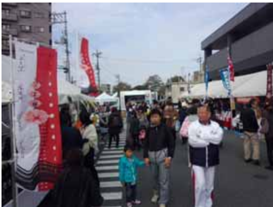
お目当ての地場産品を買い求める来場者

今回は会場を山口銀行宇部支店駐車場内に変更して開催。同フェアには5,700名が来場し、会員事業等による地場産品の直売や餅つき・くじ引き等で終日、賑わいを見せた。