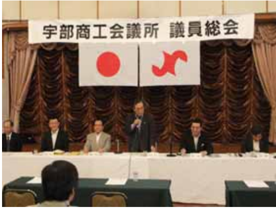
開会挨拶で平成23年度を振り返る千葉会頭