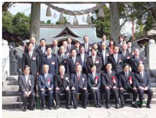
式典後の記念撮影

1日に琴崎八幡宮にて挙行。関係者約30名が出席し、宇部の産業発展に貢献した先人の偉業を讃えると共に会員事業所から推薦された24名の従業員に表彰状が授与された。