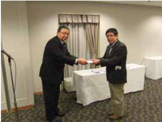
大会終了後の年末懇親会にて行われた表彰式