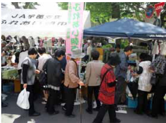
“地元宇部産”の商品を買い求める来場者

新天町名店街・中津瀬神社周辺にて開催され、18社(団体)が出店、約7千人が来場し商店街の集客に寄与した。会場では餅つき等も実施。