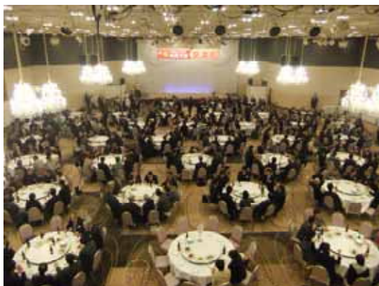
交流会で“交流”を深める参加者