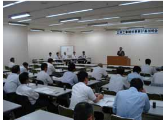
今年度概要について説明を受ける参加者