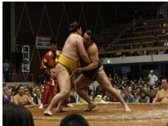
横綱同士による結びの一番