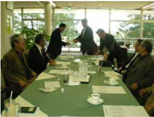
大会終了後に行われたミーティング

16日に宇部72カントリークラブ万年池西コースで開催。当日は両部会所属者との交流をはかると共に入賞を競い合った。