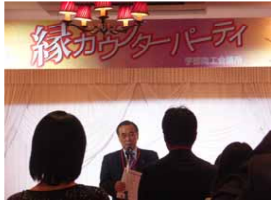
挨拶の中で参加者にアドバイスをおくる千葉会頭 小規模企業振興委員 北部勉強会

17日に国際ホテル宇部アン・セット・イルにて開催。独身男女47名が参加し、フリータイム等を行い今回は4組のカップルが成立。