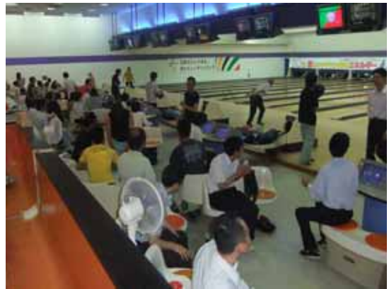
ゲームを通じて親睦を深める参加者

20日にパークレーン宇部で開催。22チーム87名が参加し、団体戦・個人戦で成績を競うとともに部会員同士、親睦交流を深めた。