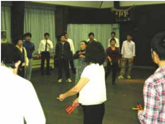
真剣に練習に取り組む参加者

11月4日の宇部まつりに当所は「華創パレード」として参加、今年も女性会による「踊り練習会」がセントラル硝子(株)宇部工場での合同練習をはじめ計18回行われ、本番に向け参加企業が士気を高めた。