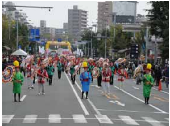
“しゃんしゃん傘踊り”を披露する女性会のみなさん

宇部まつり主要イベントである“パレード”に今年も華創パレードにて参加。宇部市制100周年に向けて「元気な宇部パワー発信」を目的に総勢2,100名で参加し、沿道の観客を魅了した。