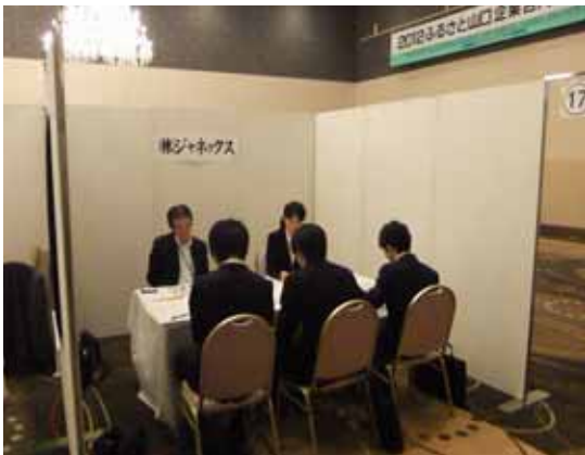
担当者からの説明を熱心に聞く参加者