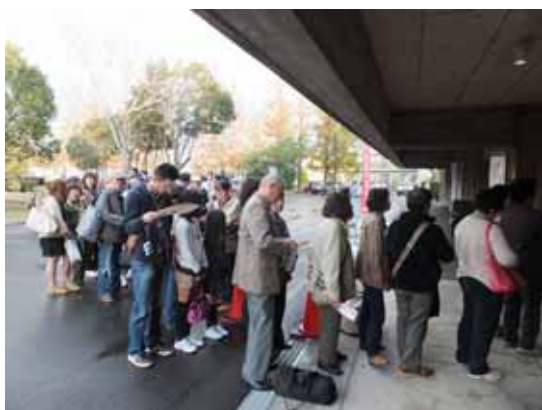
開場を待ちわびる来場者の列