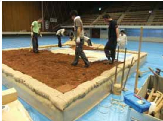
日本相撲協会指導のもと、土俵作りを行った