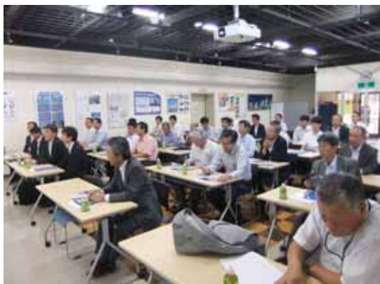
視察先担当者の説明をうける参加者

25日に先進地視察研修を開催し、35名参加のもと北九州市の榊安川電機、J-POWER電源開発(株)若松総合事業所、TOTO(株)小倉第一工場を視察した。