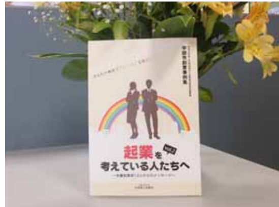
“13名の起業家”の体験談を綴った事例集

昨年度に引き続き、山口県より助成を受けた平成24年度山口県中小企業総合経営支援事業の一環として当所が取り纏めを行い発行。発行目的は「創業予定者への情報提供、創業相談窓口としての商工会議所の紹介」で、過去に当所起業塾や当所にて経営指導を受け、創業に至った13名の「起業家」の事例を紹介。