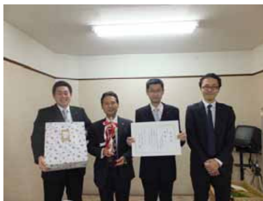
「団体の部」優勝のみずほ証券(株)宇部支店の皆さん

6日にパークレーン宇部にて開催。16社24チーム96名が参加し、「寒さを吹き飛ばす熱戦」を展開し、団体の部ではみずほ証券株式会社宇部支店チームが優勝を飾った。