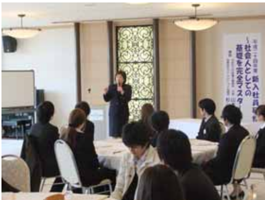
社会人としての心構え等を学ぶ参加者

10日にCOCOLAND山口宇部にて開催。入社1～3年目の社員等を対象に24社45名が参加し社会人としての心構え、ビジネスマナー等について学んだ。