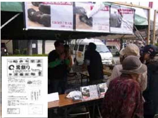
石炭包(せきたんぱお)を買い求める来場者

当日は石炭包の新作メニュー・新規取扱店の発表や黒ガチャポンくじ等を開催し石炭包のPRを行った。