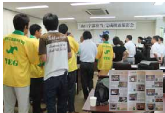
「さらに参加業者を増やしたい」と語る青年部の皆さん

青年部がプロデュースする地産地消の推進や食を通じて地元の魅力を再発見すること等を目的とした山口宇部弁当の第3弾。13社19種類の弁当が発売されることとなった。