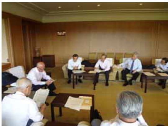
山本新山口県知事へ要望（山口県庁にて）

5月21日の山口県商工会議所連合会第90回通常総会にて採択された「山口県への要望事項」について県内12商工会議所会頭等14名が13日に山口県庁を訪問、8月に就任した山本繁太郎新知事へ要望を行った。