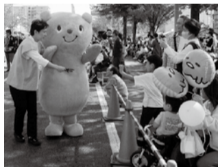
着ぐるみの行進は沿道の子どもたちに大人気