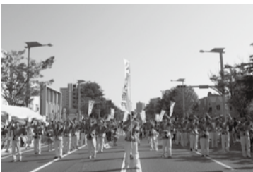
総勢120人が参加の新光産業(株)