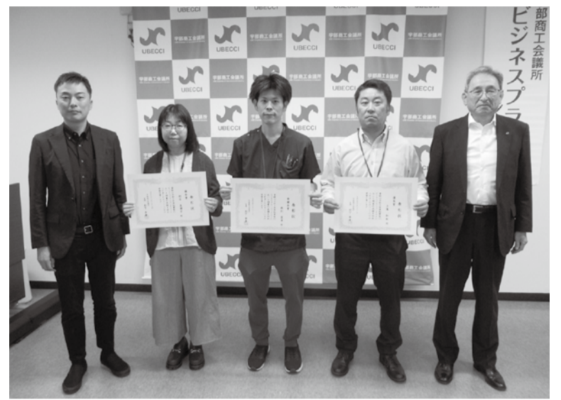
入賞者と並ぶ大下講師(左端)と杉下会頭