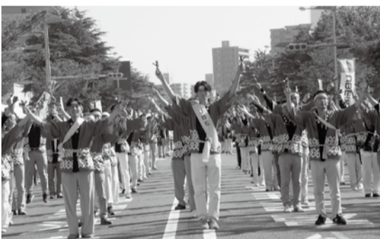
統制がとれた演技を披露するUBE(株)