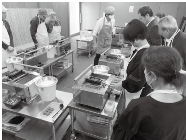
もみじ饅頭づくりに挑戦

当日は天候にも恵まれ、視察を通じて参加者同士の親睦も深まるなど、滞りなく一連研修を終えることができた。