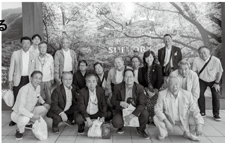
サントリー九州熊本工場にて

の雄大な自然を堪能しつつ、ゴルフや観光を行った。当日は天候にも恵まれ、視察を通じて参加者同士の親睦も深まるなど成功裡に終えることができた。