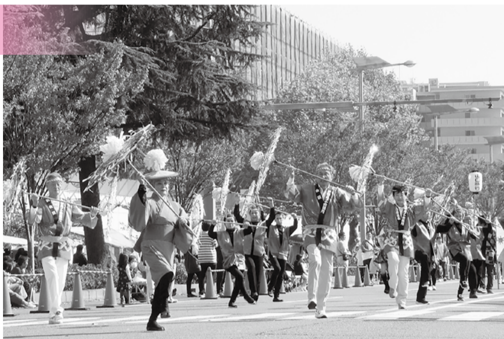
隊列先頭を務める正副会頭・女性会の面々

ご参加いただいた皆様からのご支援、ご協力を持ちまして、今年も無事に華創パレードを実施することができました。心より御礼申し上げます。ありがとうございました。