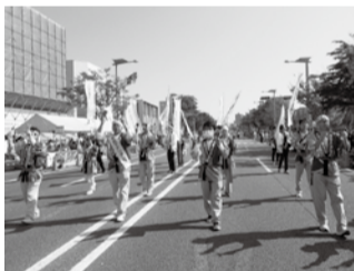
ブルーのカラーで常盤通りを染める宇部マテリアルズ(株)