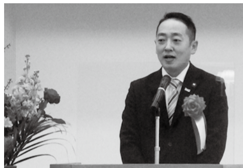
篠崎圭二宇部市長