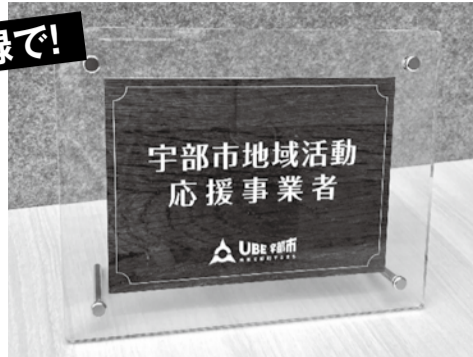
登録いただいた事業者には、認証通知書と、このプレートをお渡します。

宇部市 市民環境部 市民活動課 お問合せ TEL:0836-34-8565 FAX:0836-22-6016 E-mail:siminkd@city.ube.yamaguchi.jp