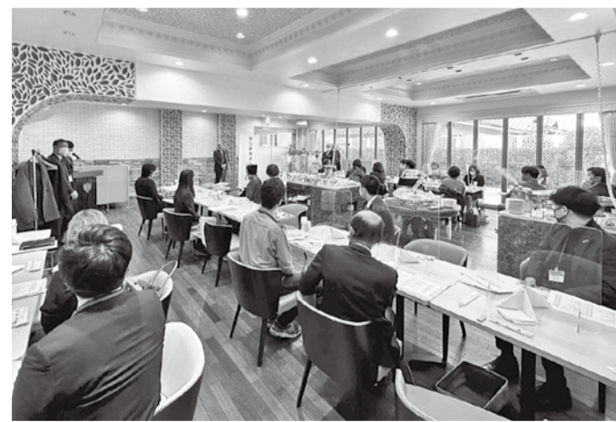
交流会会場の様子

第1部、第2部とも交流会は終始和やかな雰囲気なかで進められ、今回初の試みは好評のうちで終えることができた。