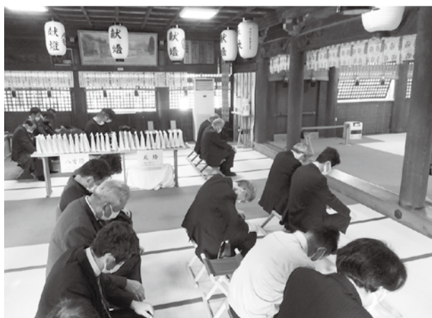
安全祈願をする建設業部会員