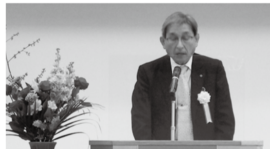
杉下会頭より感謝の言葉