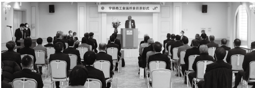
会場には来賓、関係者50人が出席