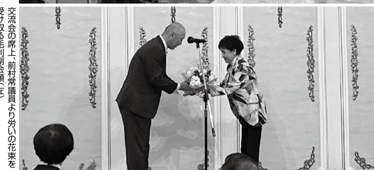
開放感あふれる交流の様子