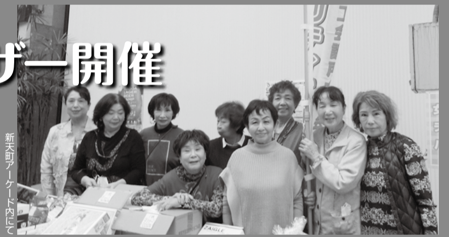
新天町アーケード内にて

を目的としており、毎年好評をいただいている。当日は、開始前から足を止めて商品を吟味する来場者の姿も見られ、たくさんの商品を用意していたが早々に完売した。