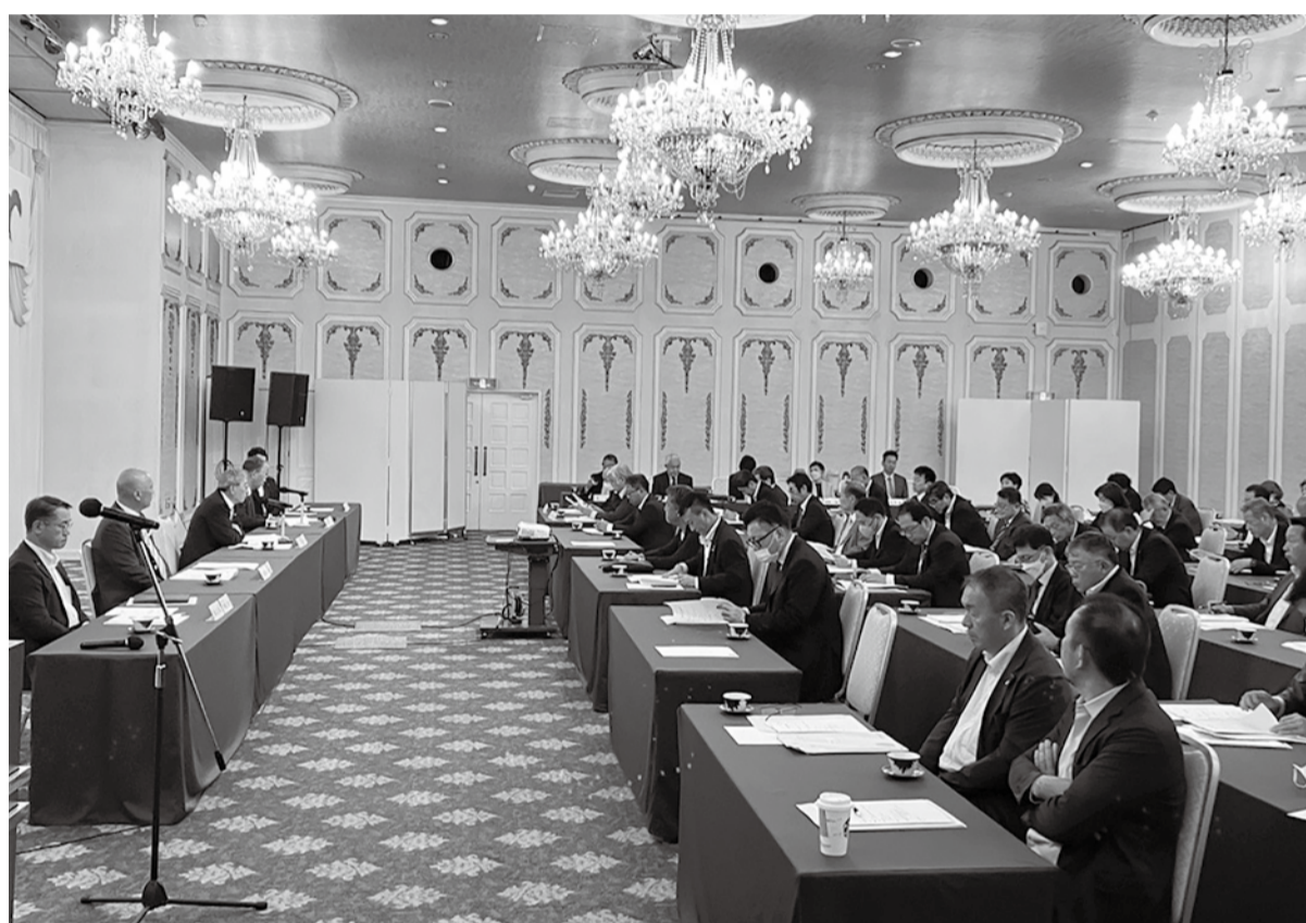
総会には常議員・議員88名が出席