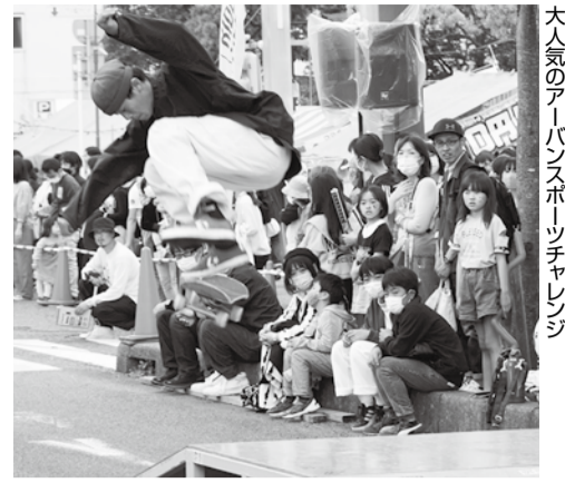
大人気のアーバンスポーツチャレンジ

心配されていた雨予報も、当日は曇りから晴天にまで回復し、私たちはこれを『新川市まつりの奇跡』と思わずにはいられません。『新川市まつり TOKIWAストリートパーク』において多くの人々が楽しんでくれたこ