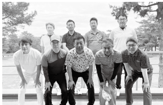
参加者のみなさん