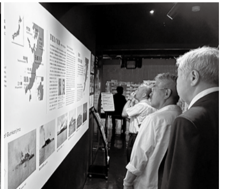
軍艦島デジタルミュージアムを見学