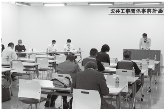
公共工事関係事業計画

参加者は15社18名。それぞれが、提示された事業と自社の参入の可能性を考える場となり、成功裡のうちに終えることができた。