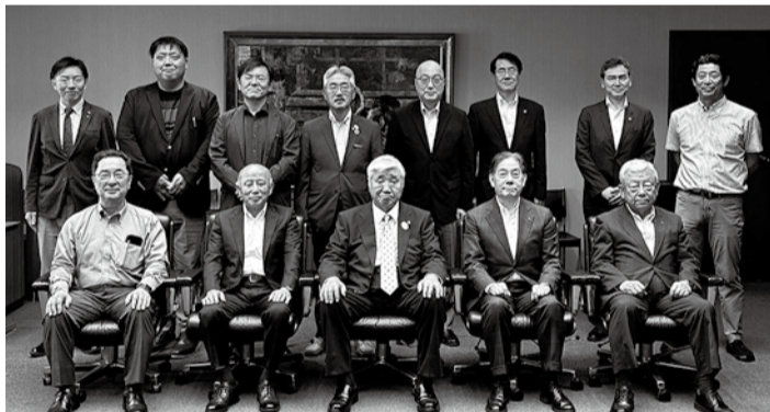
長崎商工会議所にて

天候にも恵まれ、視察を通じて参加者同士の親睦も深まるなど成功裡に終えることができた。