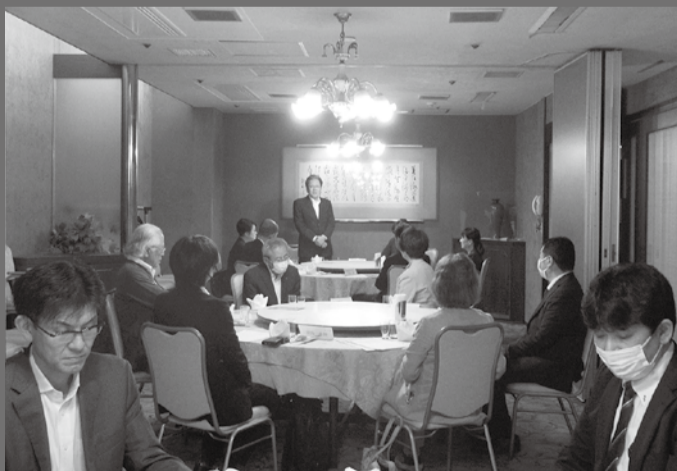
開会挨拶をする作村部会長

本幹事会では協議事項である令和4年度事業報告並びに収支決算報告、令和5年度事業計画(案)並びに収支予算(案)について事務局より説明を行い、全会一致で承認された。