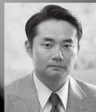
講師 / 元衆議院議員 杉村 太蔵 氏

時間 / 16:50~18:20 演題 / 人生何が起きるかわからない ～太蔵流チャンスをつかむ技術～