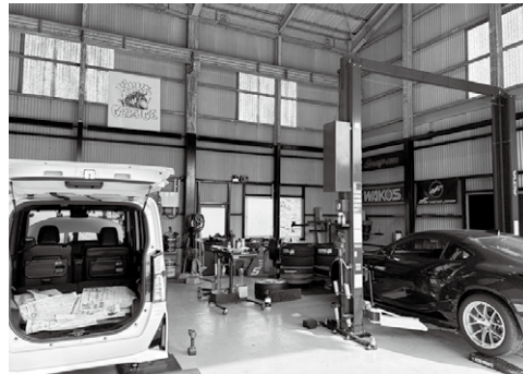
車好きの幅広いニーズに対応