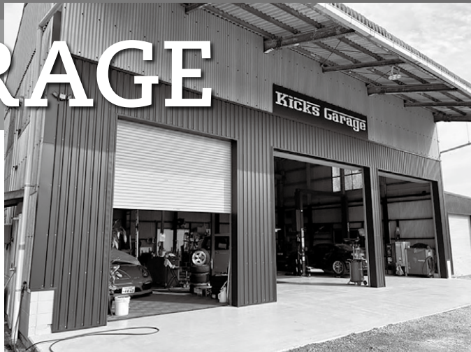
昨年、移転したばかりの新しいガレージ