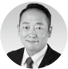
宇部市長 篠崎 圭二